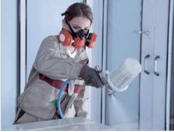
Das breite Düsenspektrum der SATAjet 1000 B macht sie vielseitig einsetzbar.